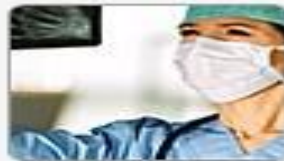
Health & Medicine