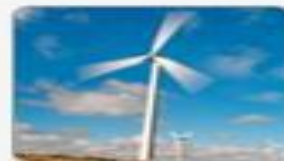
Science & Technology