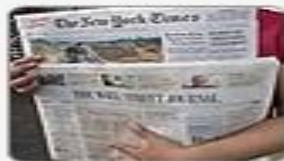
News & Newspapers