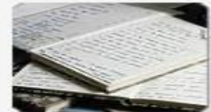
Literature & Language